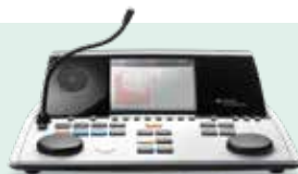
AD629 Audiometro de diagnóstico