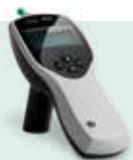
MT10 Timpanometro de mano